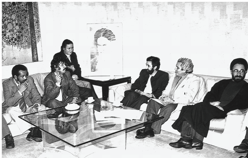
استقبال وزرای خارجه و ارشاد اسلامی ایران از هیئت لیبیایی در فرودگاه مهرآباد.

عبدالعاطی العبیدی وزیر امور خارجه لیبی و عبدالرحمن شلغم دبیر کمیته مردمی تبلیغات (وزیر اطلاعات) لیبی که روز گذشته وارد ایران شده بودند، امروز به‌طور جداگانه با آقای هاشمی رفسنجانی رئیس مجلس و علی‌اکبر ولایتی وزیر خارجه دیدار و گفت‌وگو کردند. وزیر امور خارجه لیبی در دیدار با آقای هاشمی رفسنجانی، ضمن ابلاغ پیام دوستی سرهنگ قذافی رهبر لیبی، درباره علل شروع جنگ تحمیلی و همکاری لیبی با ایران در این زمینه و اوضاع داخلی عراق گفت: ما آماده‌ایم در زمینه جنگ تحمیلی و توطئه‌های کشورهای مرتجع عرب در مقابل انقلاب اسلامی، با شما همکاری دائمی و همیشگی داشته باشیم و معتقدیم که هدف از تحمیل این جنگ به جمهوری اسلامی ایران، مبارزه با انقلاب اسلامی و متوقف کردن صدور آن به خارج از مرزهاست و این جنگ از سوی آمریکا، ارتجاع عرب و عربستان سعودی برنامه‌ریزی و تحمیل شده است، ولی ما در کنار حق خواهیم بود. وی سپس، به دیدار فهد شاه سعودی از